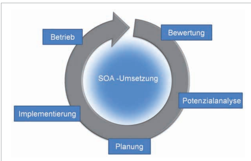
Abb. 4: Aktivitäten einer Iteration

Ob eine SOA für ein Unternehmen sinnvoll ist, hängt vor allem davon ab, ob es von einem Agilitätswachstum und einem besseren IT/Business-Alignment profitieren kann. Dies ist zum Beispiel der Fall, wenn die Geschäftsprozesse maßgeblich durch die IT unterstützt werden und sich das Unternehmen in einem dynamischen Marktumfeld bewegt. Während der Potenzialanalyse wird die Eignung